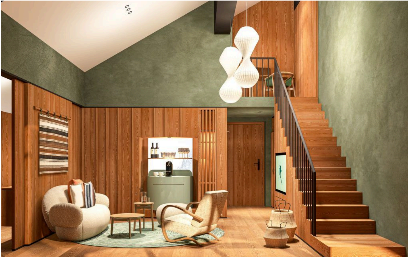
Die Zimmer haben 40 Quadratmeter und mehr. CP ARCHITEKTUR