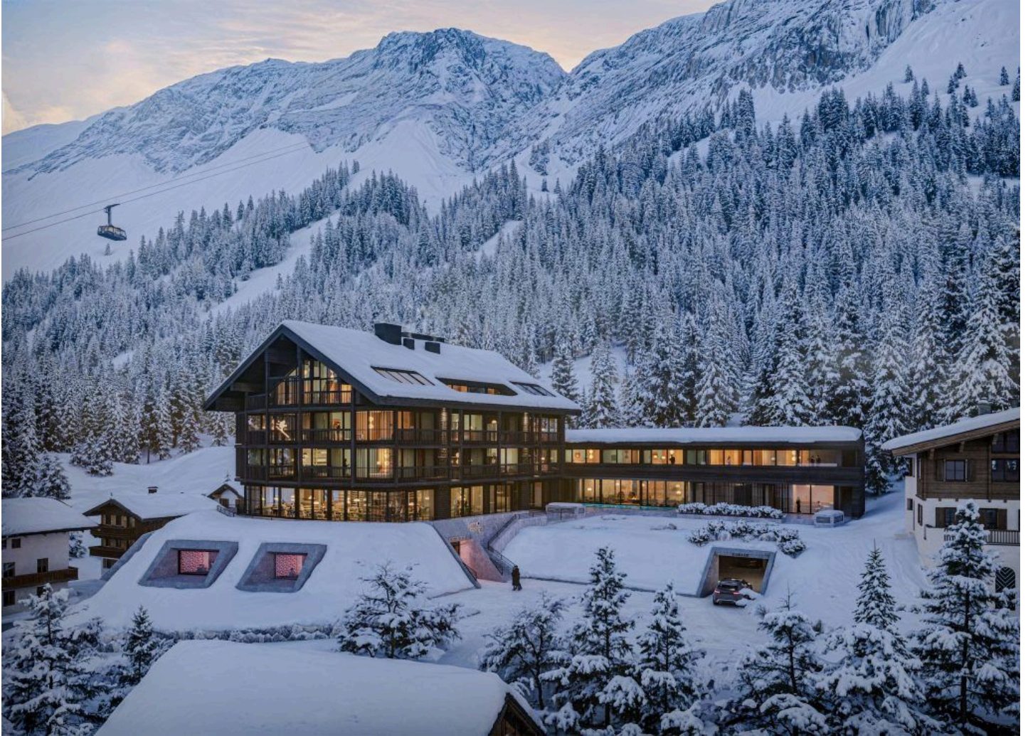
Die Visualisierung zeigt das Hotel Kristberg nach der Fertigstellung.